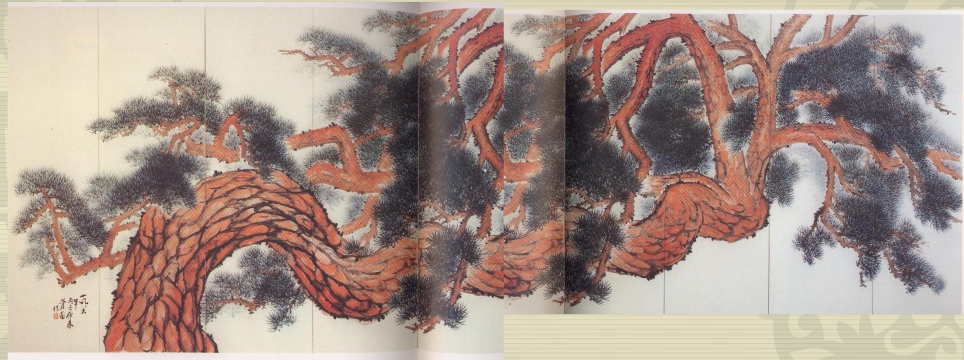
〈대관령 휴양림 (현석 이호신 화백)〉