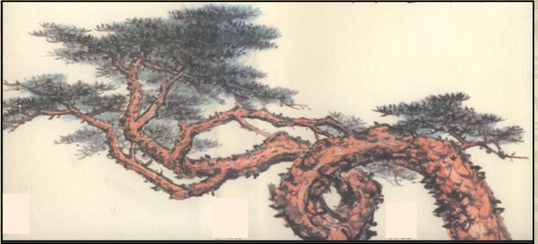
〈단호사의 적룡송 (창원 이영복 화백)〉