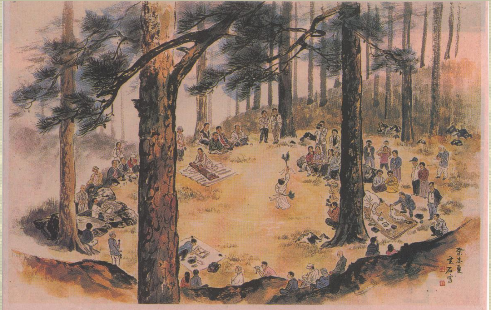
〈솔바람누리 (이호신 화백)〉